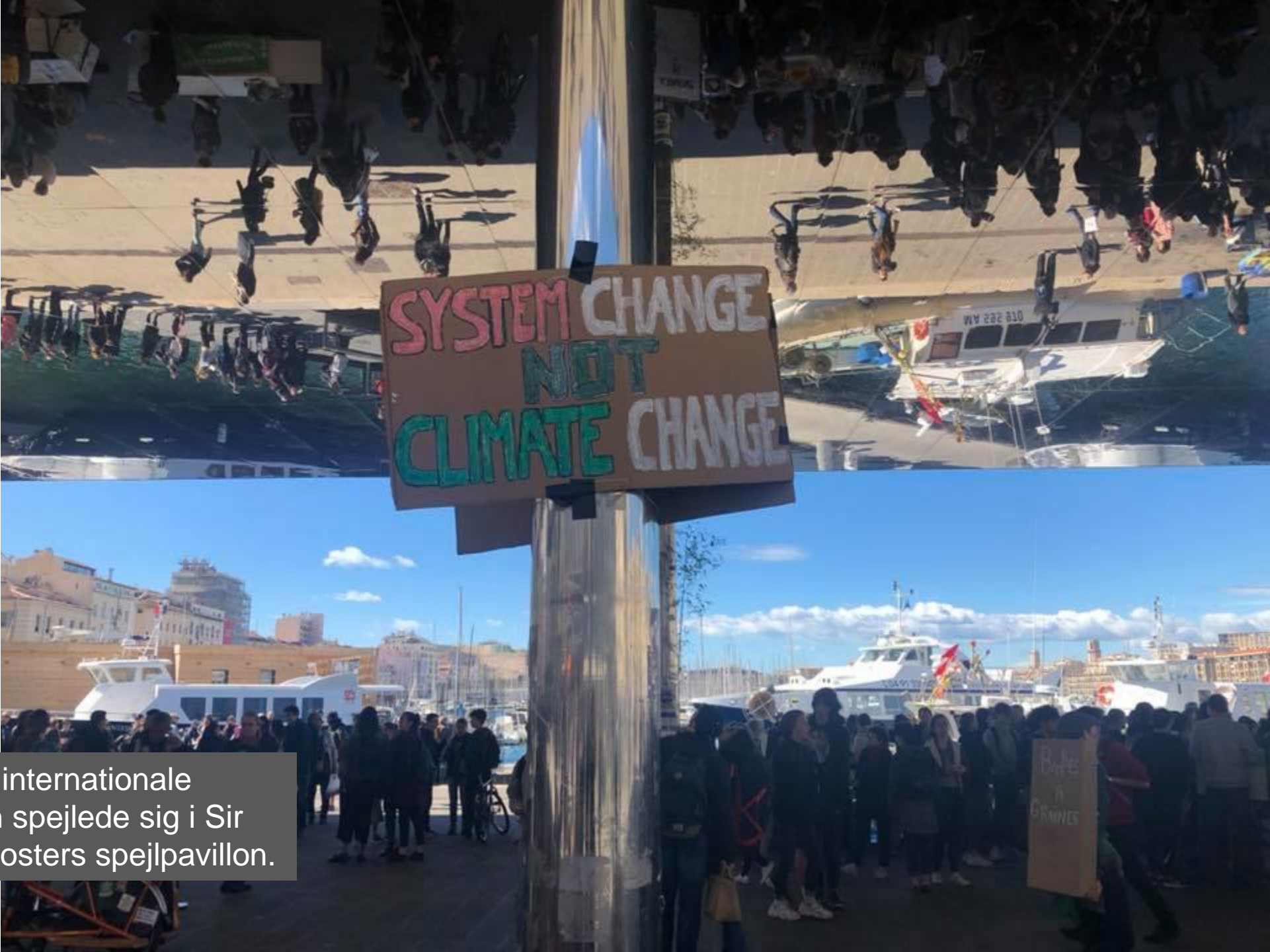
Fredagens internationale klimamarch spejlede sig i Sir Norman Fosters spejlpavillon.