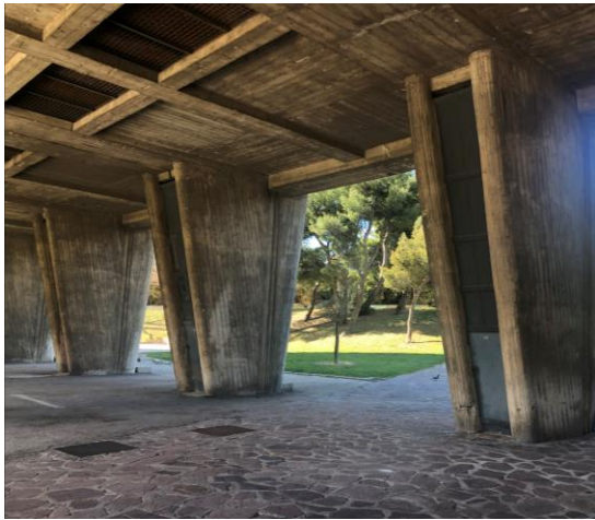
Først et blik på Le Corbusiers eksperimen- terende boligblok fra 1947