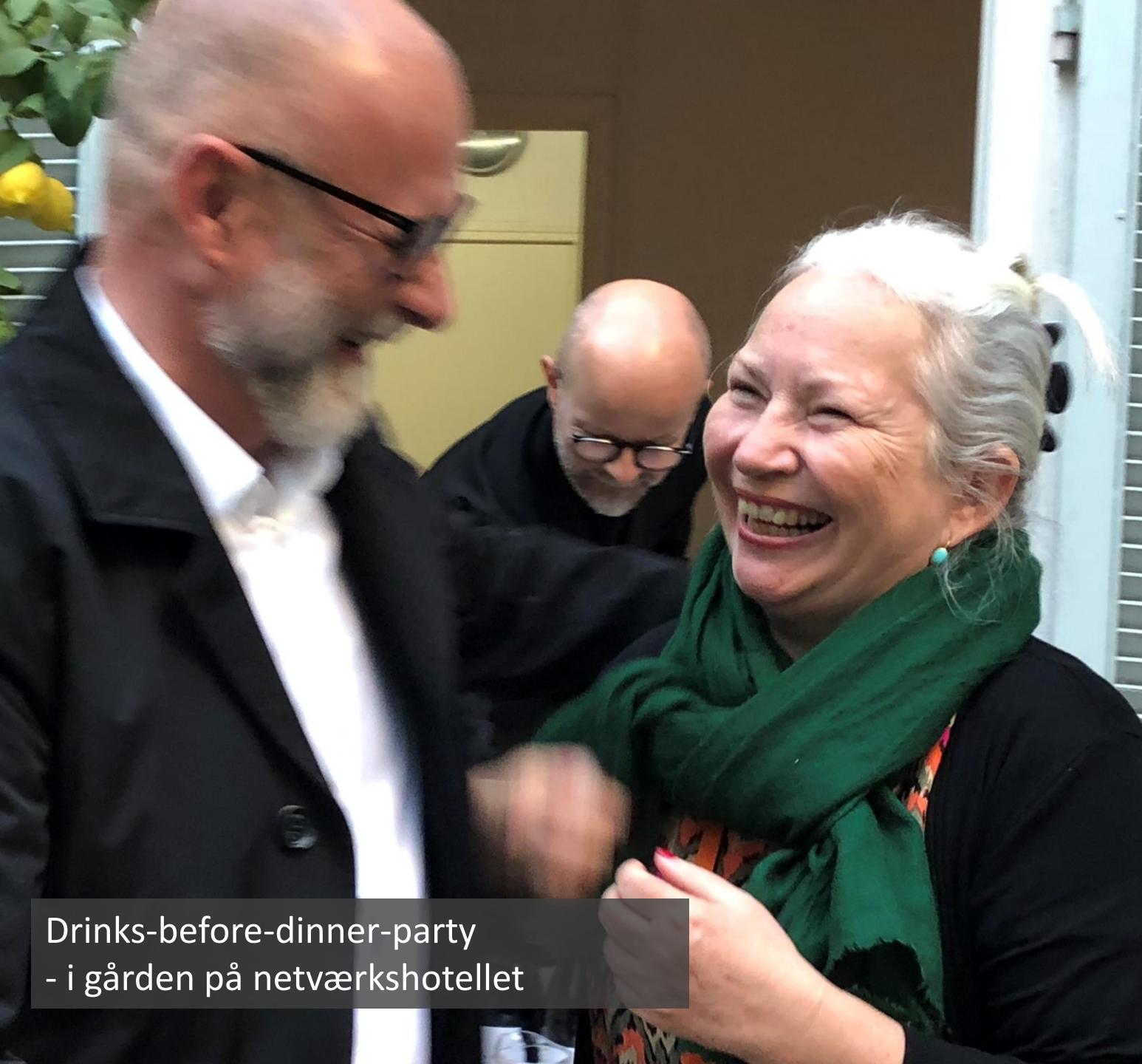
Drinks-before-dinner-party - i gården på netværkshotellet