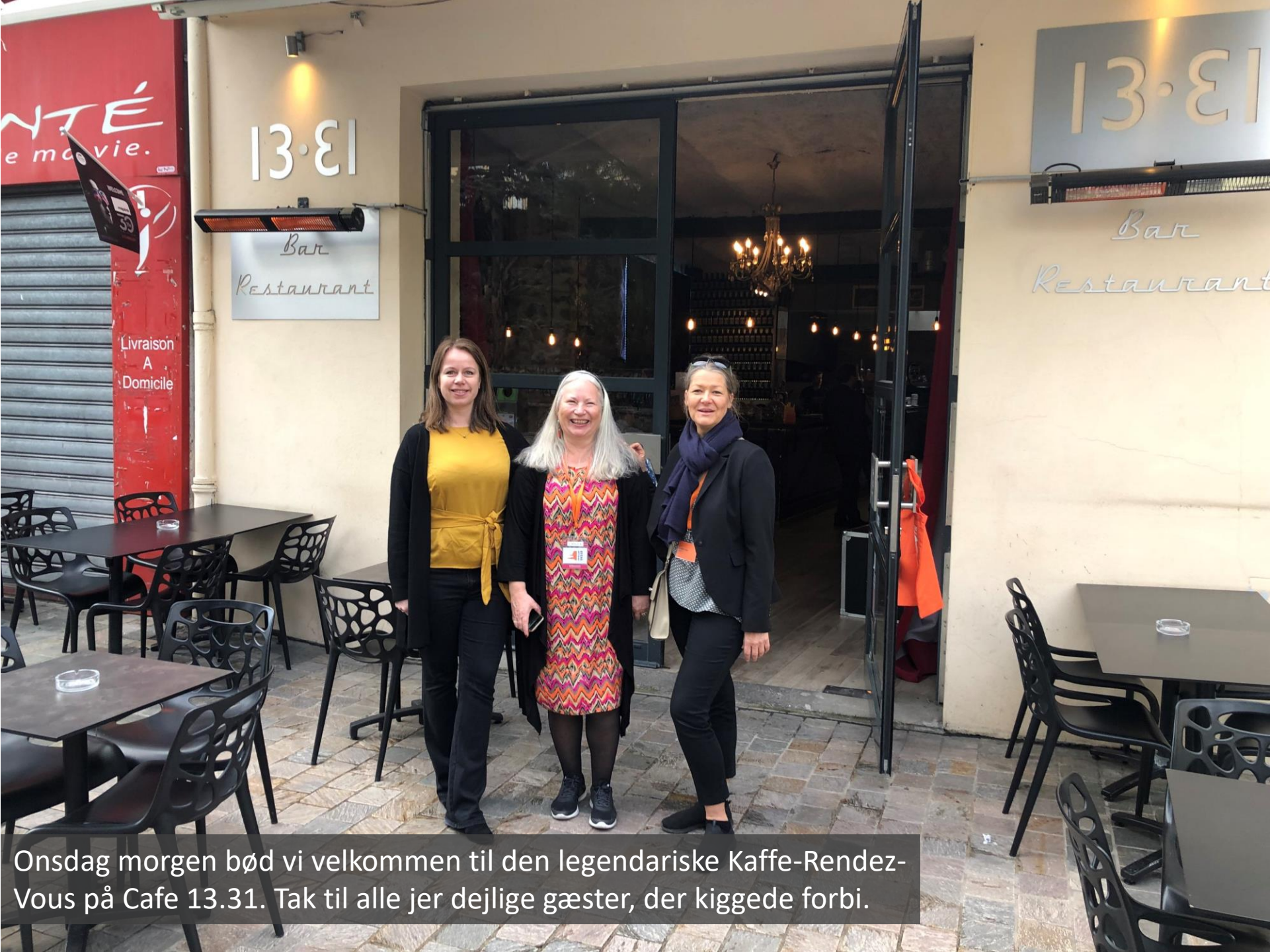
Onsdag morgen bød vi velkommen til den legendariske Kaffe-Rendez-Vous på Cafe 13.31. Tak til alle jer dejlige gæster, der kiggede forbi.